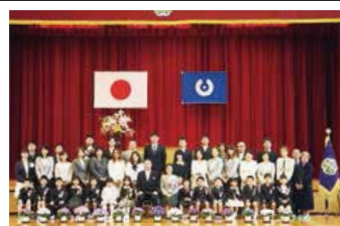
小学校の新1年生と保護者ら

4月7日、三宅村立三宅小学校、三宅村立三宅中学校、東京都立三宅高等学校とそれぞれ入学式が挙行されました。 小学校の入学式では、在校生や来賓などが拍手で迎える中、新1年生は少し緊張の面持ちで入場しましたが、入学児童呼名では元気づく返事をしていました。 今年度は小学校14人、中学校10人、高校12人、計36人の新入生が人生の新しい一歩を踏み出しました。