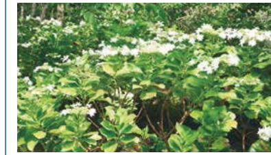
坪田地区に咲くアジサイ

他の日程でも上記イベントを実施するほか、島一周イベント、ウチヤマセンニューウ観察会もあります。 詳しくは島内に掲示してあるポスター、IP告知端末等をご覧ください。 ☎0410、FAX0458、ホームページの「アカコッコからの手紙」で検索。