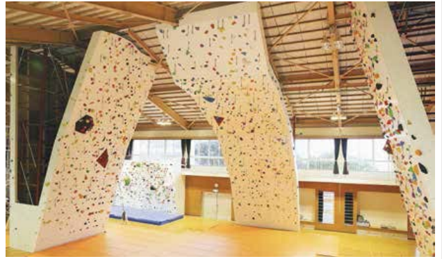
リニューアルされたクライミングウォール

3月30日、三宅村レクリエーションセンターでクライミングウォールリニューアルオープンセレモニーが開催され、多くの人でにぎわいました。 櫻田村長は、「この施設が、村民のレクリエーションの素地を培い、心身の健全な発達に寄与するだけでなく、村の観光施策の一翼を担うものと期待し、確信している。三宅島の村民だけでなく、東京都民はもとより、広く日本中の方々にこの施設を利用していただきたい」と述べました。 公益社団法人日本山岳協会の亀山健太郎副会長は、「ボルダリングとリードの