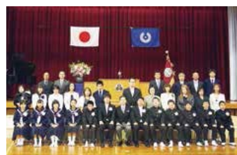
中学校の新1年生と保護者ら