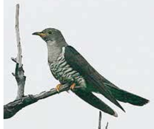
「ホトトギス」昨年は5月1日に飛来

三宅島自然だより 昔の人も気になっていました 「ホキョキョキョ」 夜やかましく鳴いている鳥は何ですか?時折、こんな質問を受けます。よく耳を澄ませてください。 「ホキョキョキョ」と聞こえませんか。その正体はホトトギスです。昔の人も気になっていたらしく、万葉集でも野鳥の中で一番多く詠われています。戦国武将の性格を表した「鳴かぬなら〜」でも有名です。