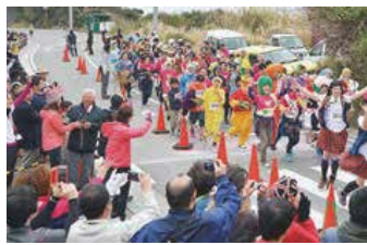
スタートするランナー(3*の部)

一昨年より1隻増えた、はえ縄船団の水揚げにも期待が寄せられ、新規漁業者の育成も順調に進んでいます。帰島10周年を迎えた今年も水揚げのさらなる飛躍が期待されます。