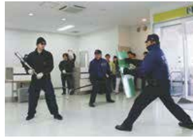
不法侵入者(左)を捕捉しようとする警官

2月26日、三宅島空港にて平成26年度三宅島空港総合訓練が行われました。訓練では、不法侵入事故対応訓練、ハイジャック対応訓練および消火救難訓練が行われ、三宅島空港管理事務所をはじめ三宅島警察署、三宅村消防本部、新中央航空(株)、(株)関商會、三宅支庁の関係者が参加しました。