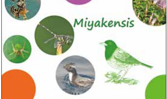
さまざまな生き物たちの情報がもり沢山！

に聞いた昔の三宅島での生活や小学生が調べた長太郎池の生き物などを掲載している号もあります。きつと気になる三宅島の情報がみつかるはず。アカコッコ館では最新号、バックナンバーともに無料で配布しています。ぜひ、お手にとってください。(1月31日(水)まで臨時休館の予定ですが、レンジャーは館内にいます。お声がけください！)