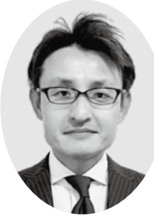
東京都三宅支庁長 田代 則史

林務関係では、雄山環状 林道、土佐林道などの復旧 工事や各林道の維持管理、 金曾沢、夕景および伊ヶ谷 での復旧治山工事に取り組 んでいるほか、カシノナガ キクイムシの被害に関する