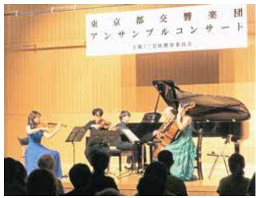
演奏する楽団のメンバー

●迫力があり、表情豊かな演奏を聞くことができて貴重な時間を過ごせました。やはり生の演奏を聞けるのは嬉しいです。皆さんが楽しんで演奏される姿