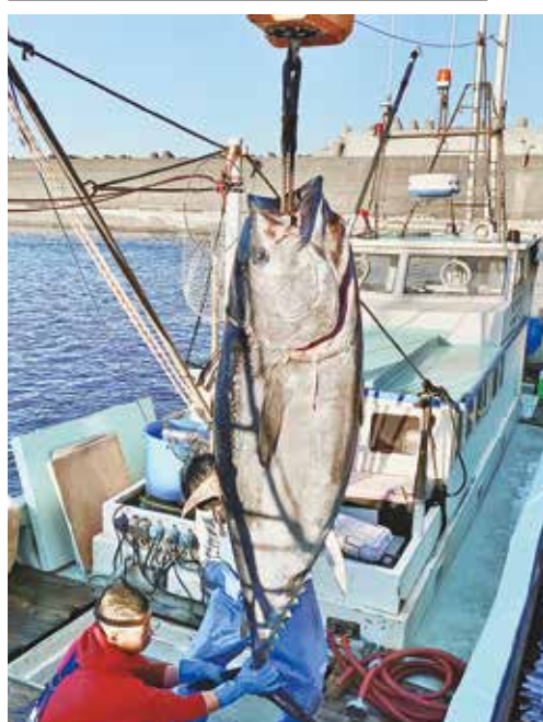
水揚げされたクロマグロ(阿古漁港)

▽会場 三宅村コミュニティセンター 問い合わせは三宅島文化会 ☎1239(穴原)。