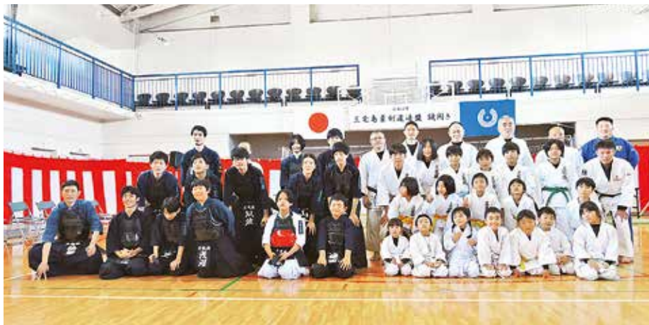
鏡開きで練習成果を披露した柔剣道の選手

1月7日(出)、三宅村コミュニティセンターにおいて、三宅島柔剣道連盟合同の「令和5年三宅島柔剣道連盟鏡開き」が開催されました。