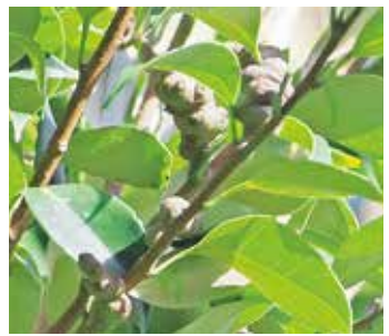
奇形となったスタジイ

この虫について調べている先生の最新の調査結果がでました。それによると、①この虫は近年、南西諸島から伊豆諸島南部の島へならんかの理由に入ってきた。②伊豆諸島にはこの虫の天敵がおらず爆発的に増