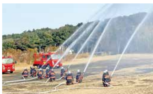
一斉放水する団員