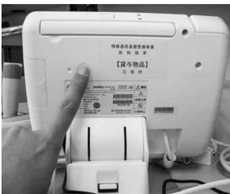
本体の裏側にある電源ボタン