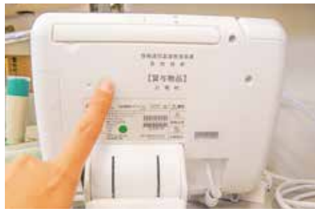
本体の裏側にある電源ボタン

2・再起動の方法 IP告知端末の背面にある電源ボタン(1円玉サイズ)を「ピッ」という音が出るまで押してください。