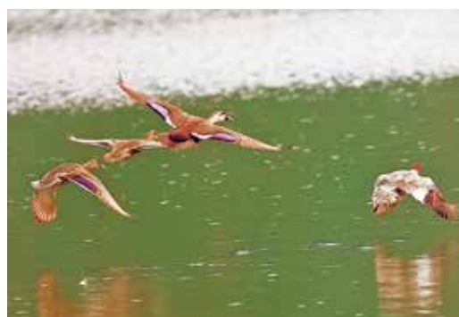
これから目にすることが多くなるカモの仲間