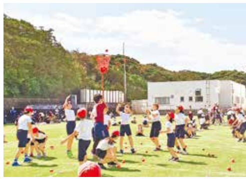
玉入れをする児童たち

10月3日、三宅村立三宅小・中学校運動会が午前と午後に分けて、開催されました。今年も、新型コロナウイルス感染症対策により参加者は保護者およびその家族だけとなっていました。今年も、新型コロナウイルス感染症対策により参加者は保護者およびその家族だけとなっていました。今年も、新型コロナウイルス感染症対策により参加者は保護者およびその家族だけとなっていました。