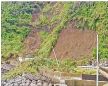
ふるさとの湯の源泉被害

台風14号により、ふるさとの湯の夕景温泉が土砂の被害を受けました。復旧には時間がかかることが予想されます。