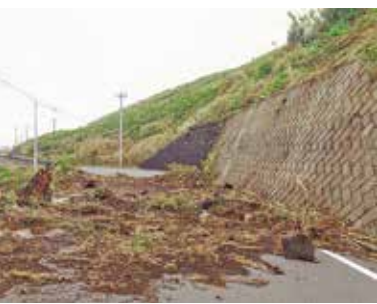
土砂に埋もれた都道

三宅村では台風14号の接近に備え、10月9日に災害対策本部を設置し、伊豆避難施設を開設しました。また、10日午前10時には土砂災害の危険性が高まったことから、避難勧告を発令し、各地区の避難所も同様に開設しました。それぞれ避難所では、コロナウイルス感染症対策を徹底し、運営にあたりました。更に激しい雨が降り