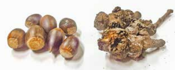
ドングリ(左)と奇形となったドングリ(右)

三宅島自然だより 「ドングリに注目！」 身の回りにスタジイの実(ドングリ)は落ちていませんか? ドングリでなく、これ(写真参照)を見ることが多いのでは? 三宅島では長い間、ドングリが実らない病気が続いています。スタジイにとってドングリは自分の子孫を残すための大切なもの。これからもその病気が続けば、未来の三宅島の森にも影響があるかもしれません。