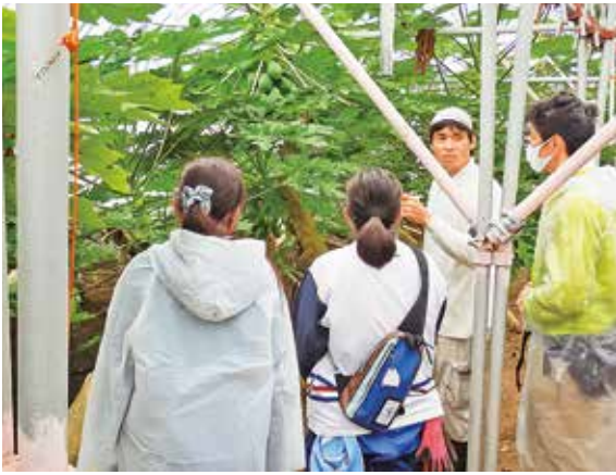
栽培について説明を聞く参加者

最終日は意見交換会を実施し、参加者からは「農作業の一連の流れを体験でき、多くの学びを得られた」とも充実した4日間でした。三宅島は景観がとてもすてきで移住しての就農の気持ち