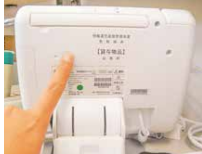
本体の裏側にある電源ボタン

IP告知端末の調子が悪い時 IP告知端末の調子が悪い、エラーメッセージが表示される、故障かなと思ったり、まず「再起動」をお試しください。 再起動の方法 ① 端末本体の裏側にある電源ボタンを押す。(受話器が外れていると再起動できません)