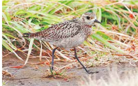
クリっとした目がかわいい「ムナグロ」

鳥の中には季節によって生活する場所を変えるものがいます。例えばツバメは春夏を日本で過ごし、秋冬は東南アジアなどで過ごします。一方カモの仲間などは秋冬を日本で過ごし、春夏はロシアなどで過ごします。自らの力で海を越え、国を越える体力に驚かされますね。でも、もっと長距離を移動するものがあります。春や秋に三宅島の海岸や草地などで見かけるチドリ仲間「ムナグロ」もそんな一種です。アカコッコと同じくらい小さな鳥ですが、春夏を過ごすロシア北部と秋冬を過ごすオーストラリアやイ