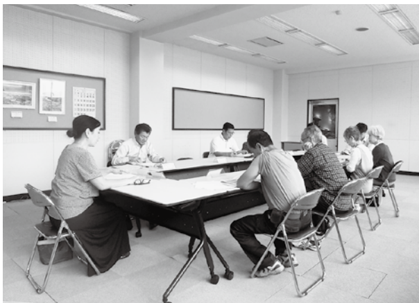
推進計画などについて協議する委員

令和元年7月17日(水)、三宅村花いっぱい推進部会を以て花いっぱいにする活動について議論いたしました。