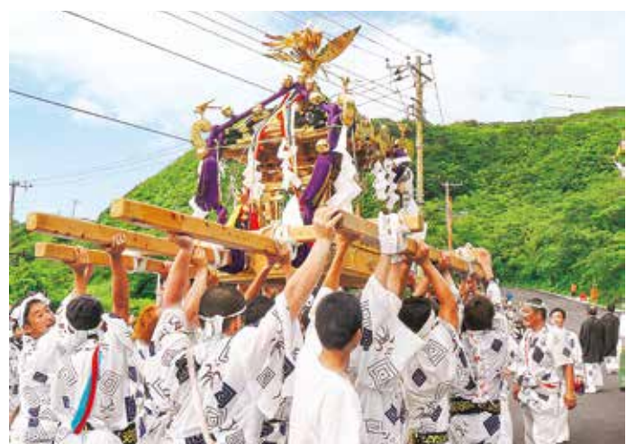
島を巡る富賀神社のみこし

2年に1度の富賀大祭において、神輿(みこし)が島を巡行する富賀神社の巡り神輿が8月4日から9日まで行われました。4日に富賀神社から宮出しされた神輿は阿古、伊ヶ谷、伊豆、神着、坪田の各地区の神社に1泊しながら6日間かけて全島を1周しました。連日暑い日が続きましたが、神輿の受け渡しには帰省客や観光客など多くの人が見物に訪れていました。9日に神輿が富賀神社に納められ、島あげでの熱い祭りは幕を閉じました。