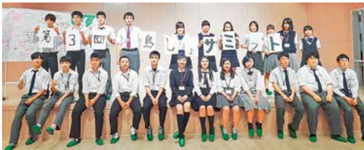
島しょサミットの参加生徒たち

9月29日(日) 午後1時〜2時 場所 三宅高校校舎棟 問い合わせは都立三宅高校 校舎 01136。