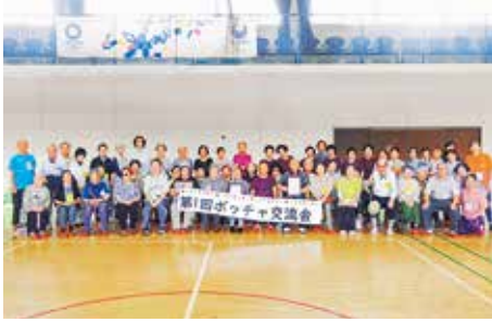
参加者の集合写真

地区連合の組織ですが、2000年の噴火による全島避難で休会状態になり、昨年再開いたしました。活動再開の第1回交流会はポッチャ競技を通して交流を深めることを目的に80名近くの会員が集まりました。各地区サロンの協力で競技が始まり、途中警察署長の飛び入り参加もあり、大いに楽しみました。