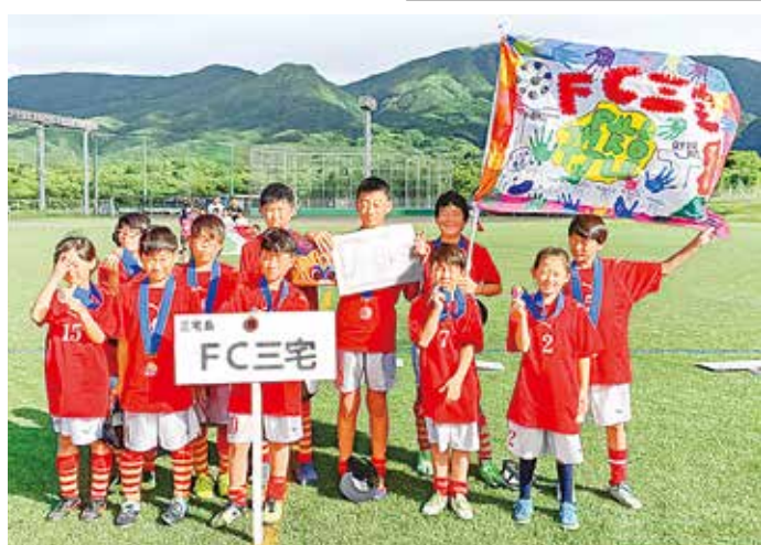
3位に入賞したFC三宅メンバー

8月3、4日に「愛らんどリーグ2019」サッカー大会が八丈島で開催され、伊豆諸島、小笠原諸島