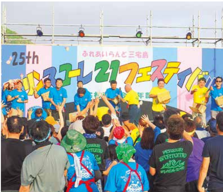
毎年恒例のもちまき

場所は阿古～伊ヶ谷間に位置するスミズリ地区で、施設の概要は火葬炉2基・炉前ホール・告別室(約70人収容)・霊安室・一般控室・遺族控室・宗教者控室・配膳室・多機能トイレ・授乳室などが整備され、斎場としての役割も備えた施設です。現在施設内の備品などを準備しております。本施設の供用開始日などの詳細については再度周知いたします。問い合わせは地域整備課環境整備係 ☎09338。