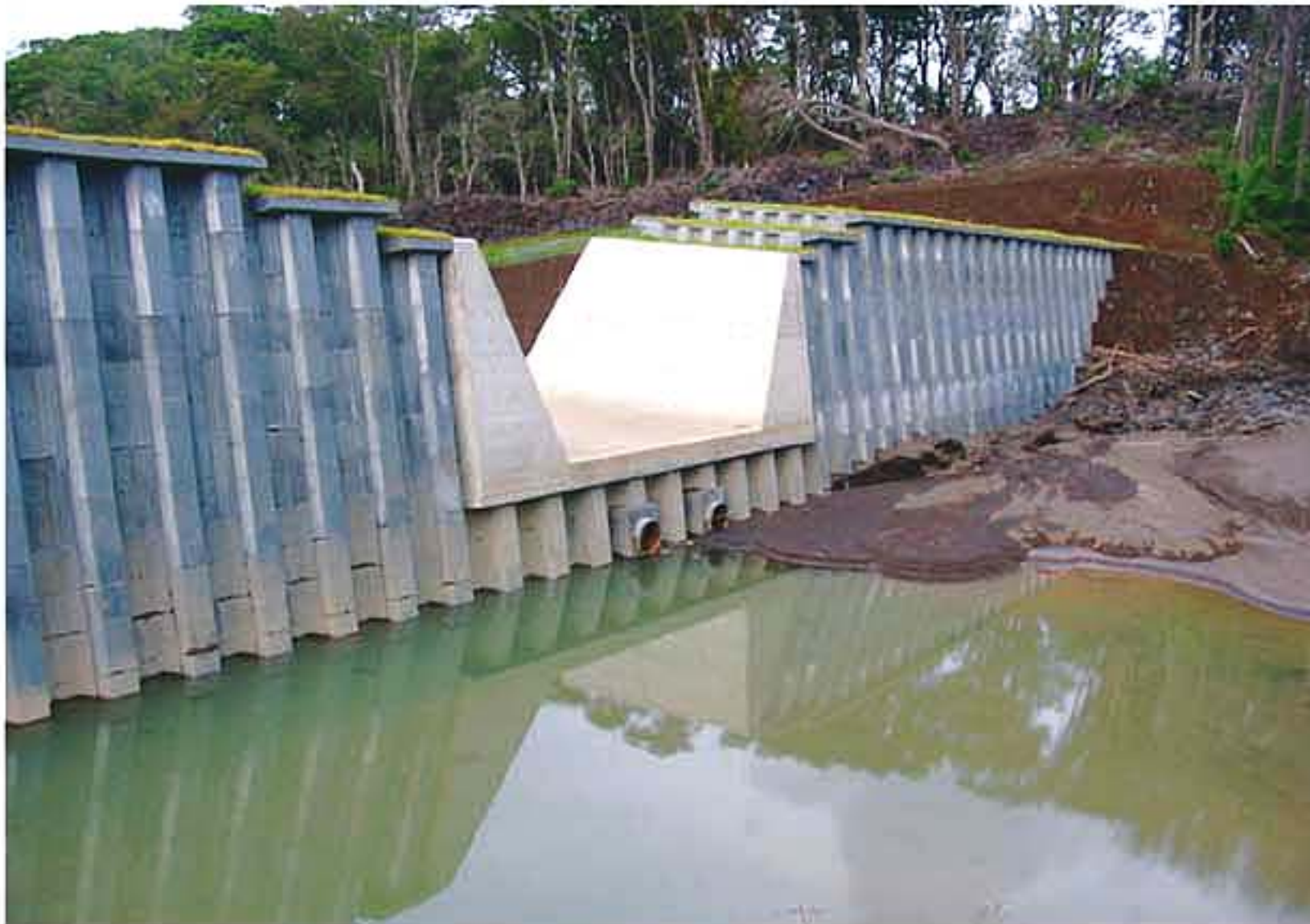
台風13号による泥流を防いだ砂防ダム (川田沢)

8月19、20日に三宅島を通過した台風13号の被害調査が20、21日の2日間で行われました。 三宅支庁、三宅村がまとめた被害報告は次のとおりです。 ▽一般家屋―特に被害なし。 ▽都道―鉄砲場で約50戸にわたり高さ3層の泥流が発生。空港入口で約20戸にわたり高さ0.5層の泥流が発生。いずれも処理され通行に支障はなし。 ▽砂防―特に被害なし。 ▽港湾―三池港海岸防潮堤が一部破損。 ▽村道―岡堀団地前道路で約30戸にわたり高さ1層の泥流が発生。4カ所で倒木確認。釜方1号線で高波による海岸からの砂利がたまり積。いずれも処理され通行に支障はなし。 ▽水道―特に被害なし。 ▽三宅村各施設―特に被害なし。