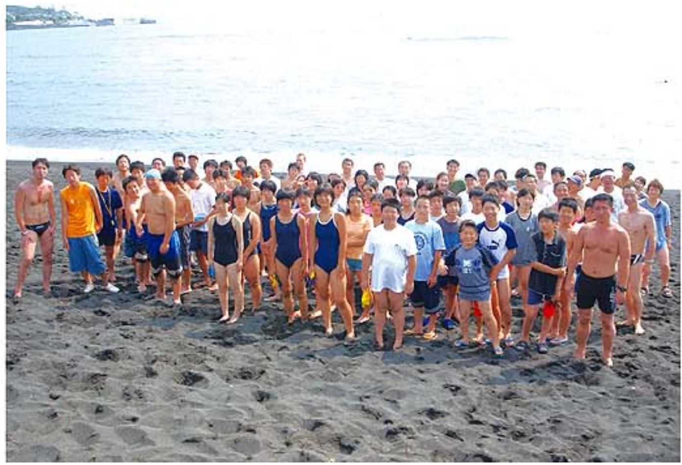
参加者全員での記念撮影(大島湯の浜海岸)