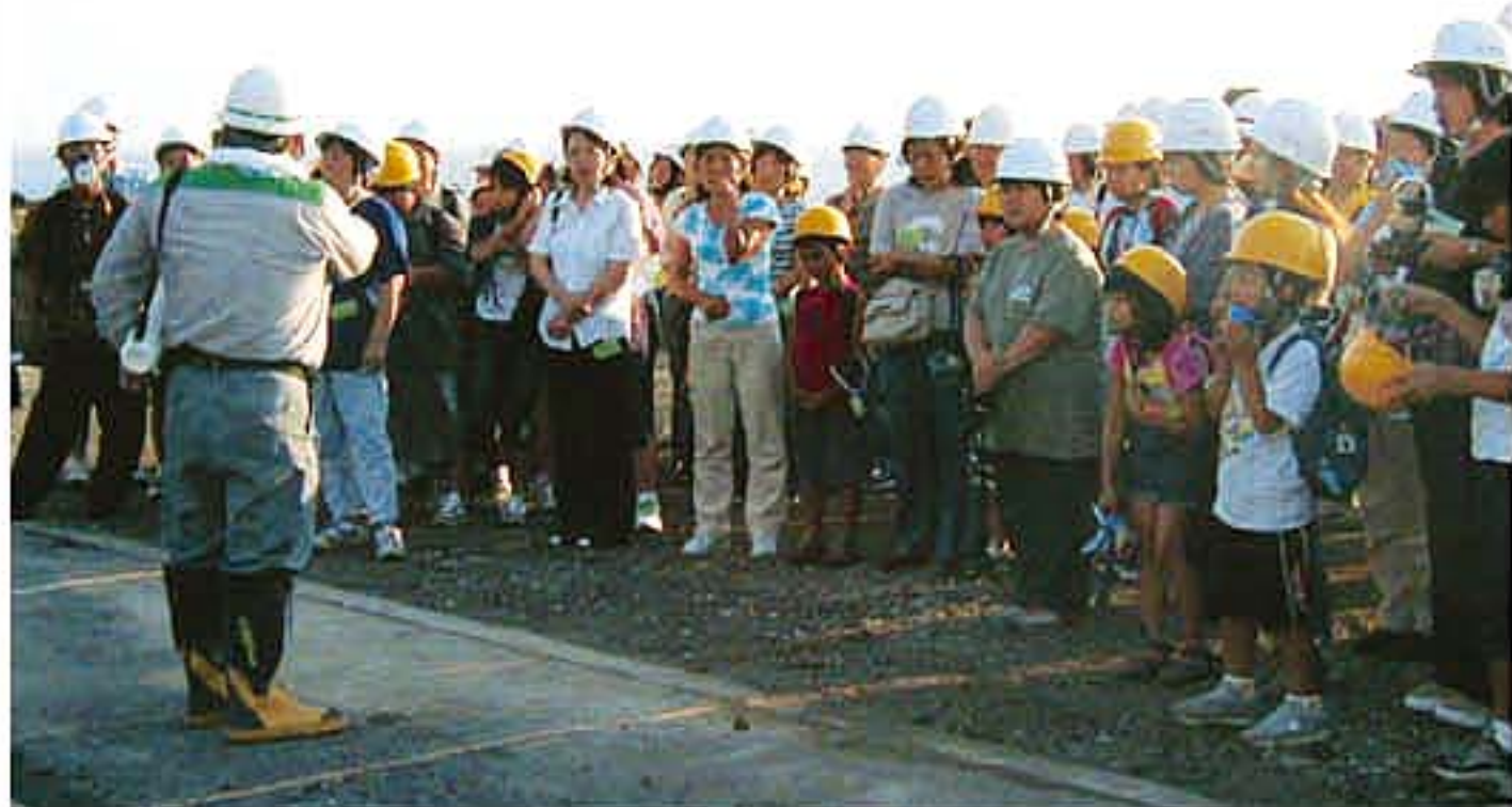
復旧作業の説明を受ける児童・生徒 (赤場暁)

参加者は小学生113人、中学生86人、高校生81人、保護者16人の計441人でした。各地区別の内訳は坪田地区114人(児童生徒70人、保護者44人)、阿古地区150人(児童生徒94人、保護者56人)、三宅地区181人(児童生徒116人、保護者66人)でした。