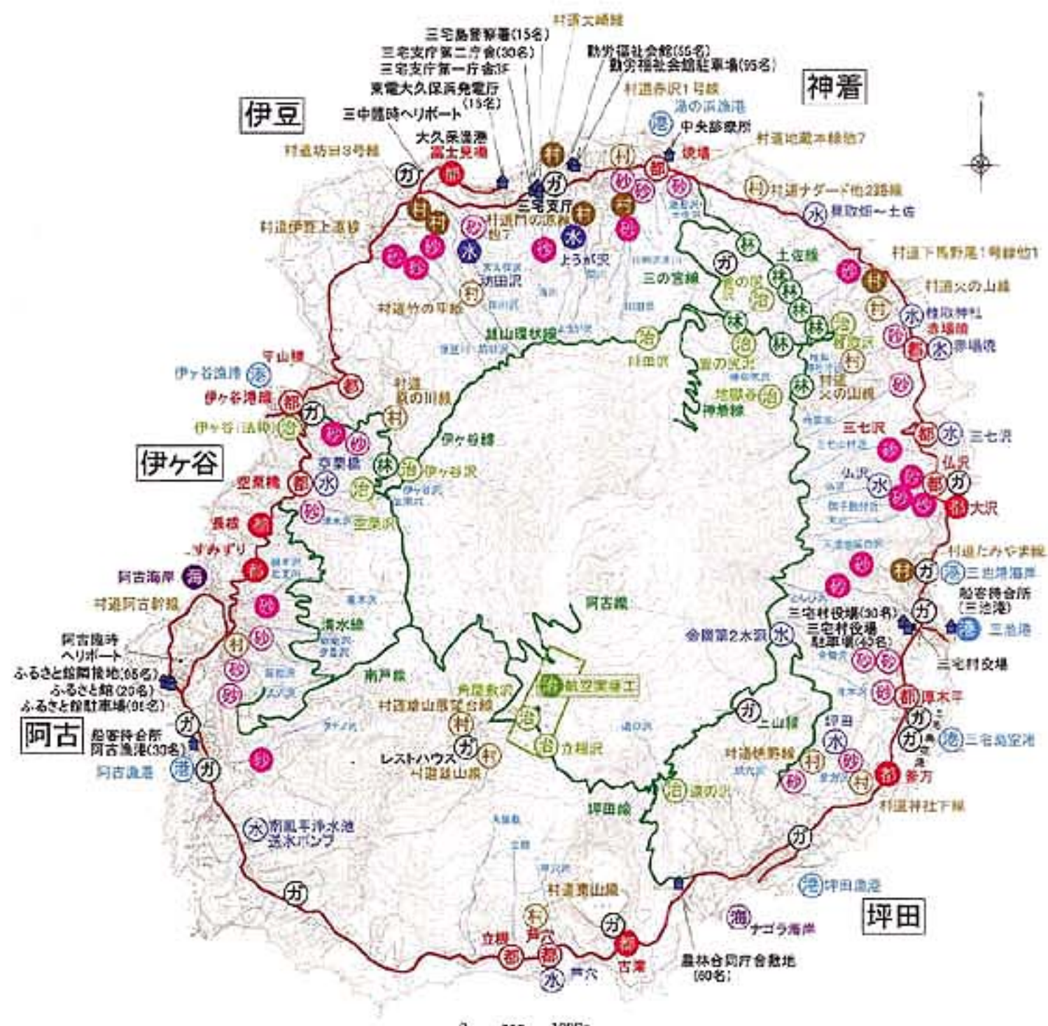
平成14年度 三宅島災害復旧計画図

民芸品などの制作体験、実演などを行う「ワークショップビレッジ」は、東京都産業界技術研究所の協力で火山灰をのりに溶かし、図柄を切り抜いた型紙を使ってプリントする「火山灰プリンター」のコースターづくりを体験できるコーナーを設け、多くの家族連れがコースター作りに挑戦しました。