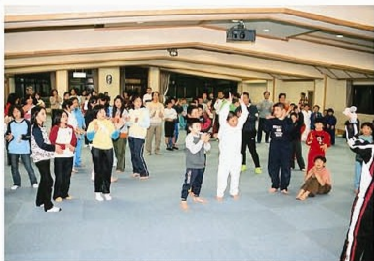
転出した子供たちとの交流会

転出した子供たちにも呼びかけて交流事業を実施してきました。昨年末には志賀高原での雪遊び・スキーツアーを実施し、多数の参加をいただきました。さらに、この3月にも次のような交流行事を計画していますのでぜひご参加ください。