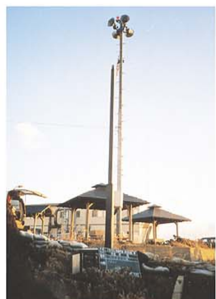
設置された防災無線屋外拡声子局