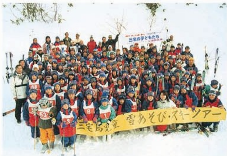
雪あそびスキーツアー