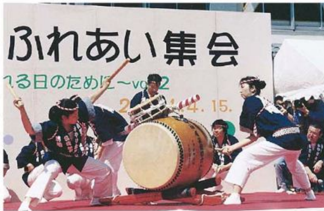
帰島の願いを込めて打ち鳴らす木造太鼓

平成13年4月15日、東京港区芝浦小学校で、「第2回三宅島島民ふれあい集会」が開催されました。当日は最高の天候に恵まれる中、久しぶりに顔を合わせた人の中には抱き合ったり、手をとりあって喜ぶ人の姿が会場のあちらこちらでみられました。