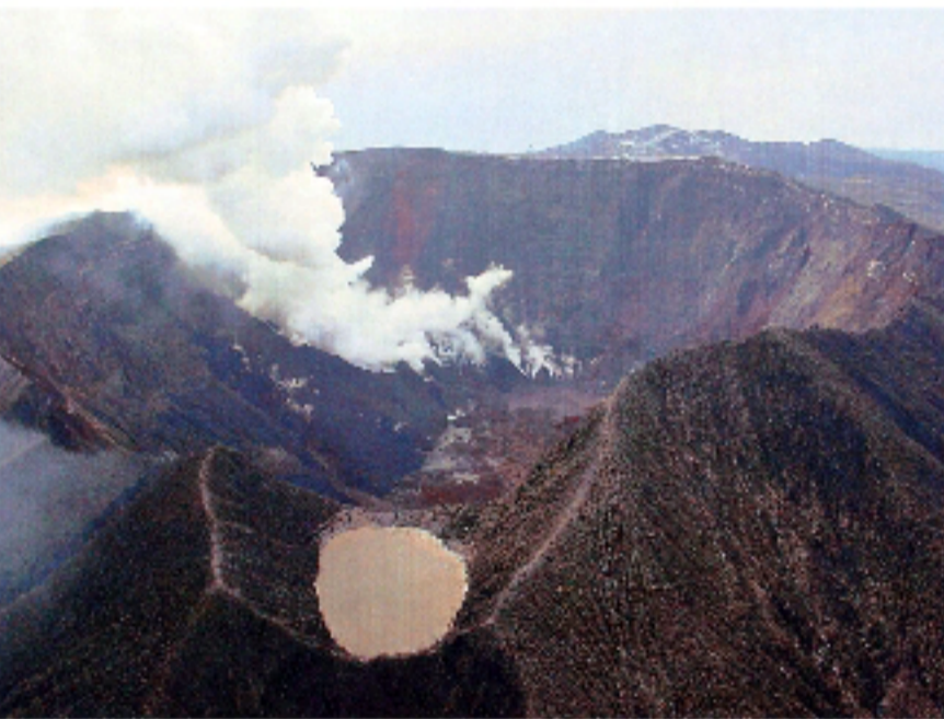
雄山(青白色)の火山活動状況。写真は雄山(青白色)の火山活動状況。

雄山(青白色)の火山ガスが山ろくに流れているのが観測されています。雄山(青白色)の火山ガスが山ろくに流れているのが観測されています。雄山(青白色)の火山ガスが山ろくに流れているのが観測されています。